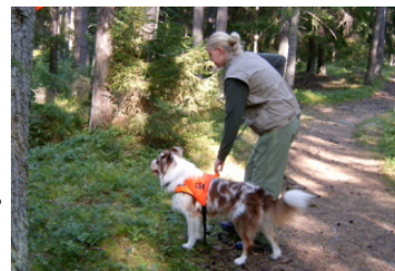
Koncentration innan sökarbetet får börja.

Belöning hos figuranten - hela belöningen ska ges av figgen, tycker hunden om att leka kan kamptrasa vara bra som belöning och/eller godis. I början kan man använda godis.